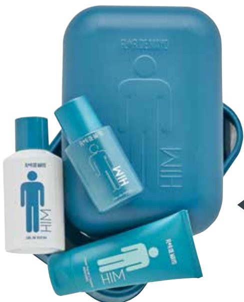
◀ Him Eau de parfum, gel e creme facial-corporal.