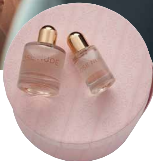
Rose Nude ▶ Eau de parfum e eau de parfum mini. Sabia que...? A sua caixa com desenho em relevo é inspirada numa pequena chapeleira vintage.