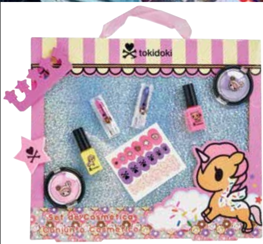
Tokidoki * Duas sombras de olhos, dois batons, dois vernizes de unhas, separador de dedos, lima e autocolantes para decorar as unhas.