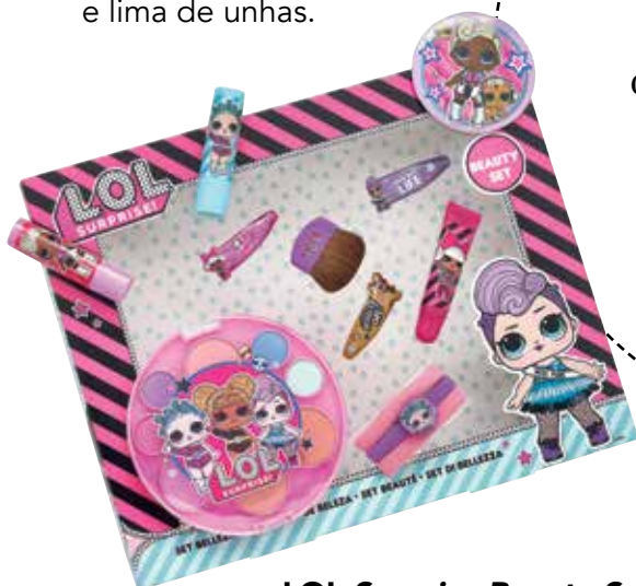
LOL Surprise Beauty Set * Paleta sombras e blush, pincel, dois batons, um lip gloss, ganchos e elásticos de cabelo, e um espelho.