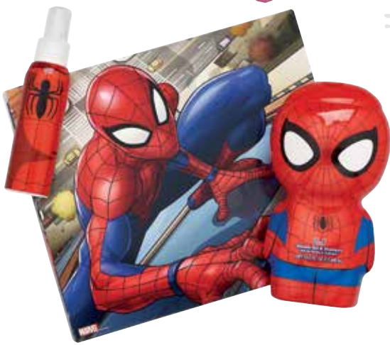
Spiderman Eau de toilette e gel-champô figura.