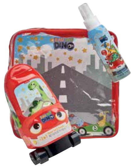
My Dino Eau de toilette e gel figura.