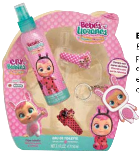
Bebés Llorones * Eau de toilette, porta-chaves com espaço para foto e ganchos para o cabelo.