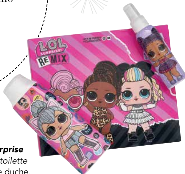
LOL Surprise Eau de toilette e gel de duche.