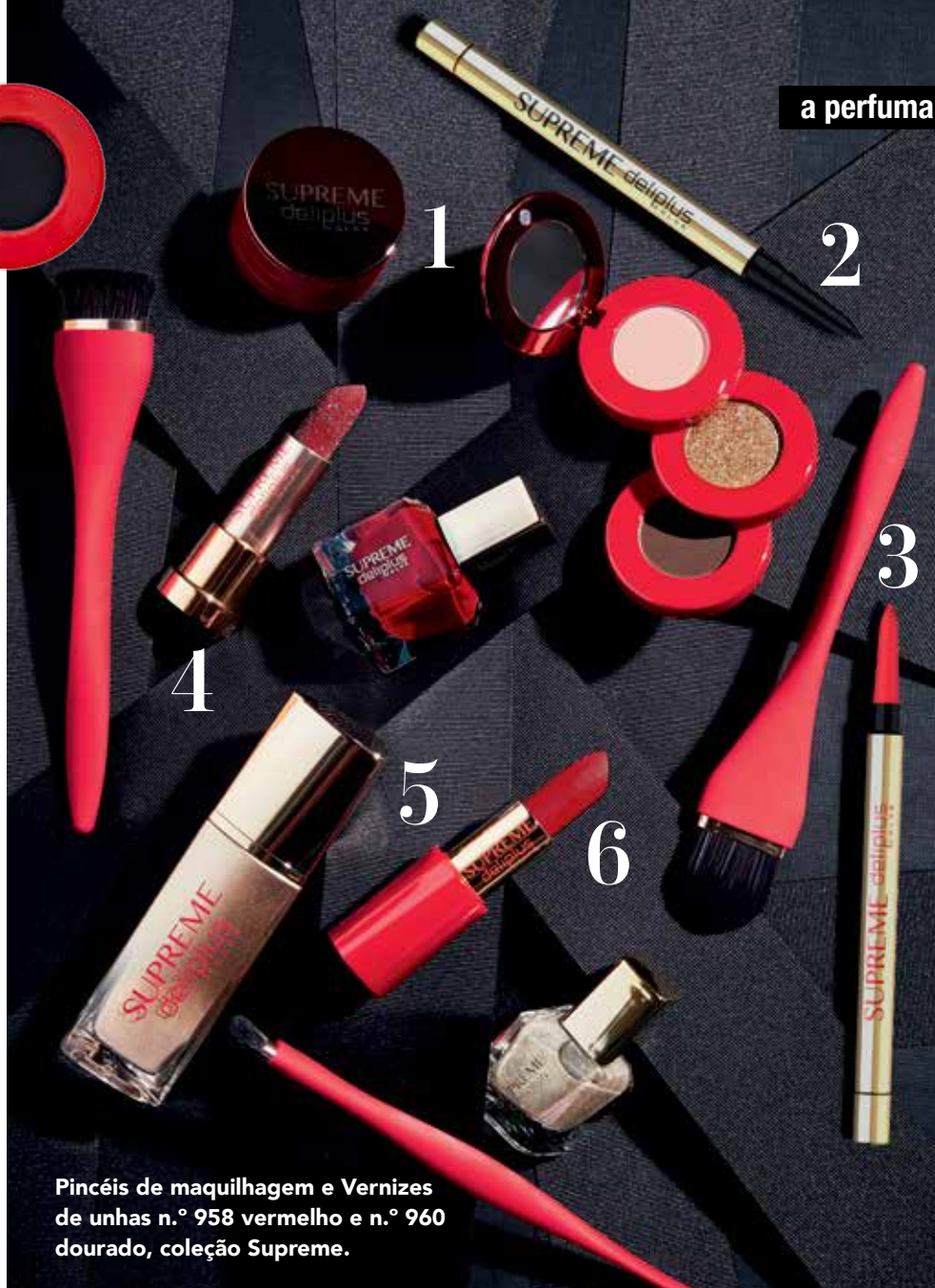
Pincéis de maquiagem e Vernizes de unhas n.º 958 vermelho e n.º 960 dourado, coleção Supreme.