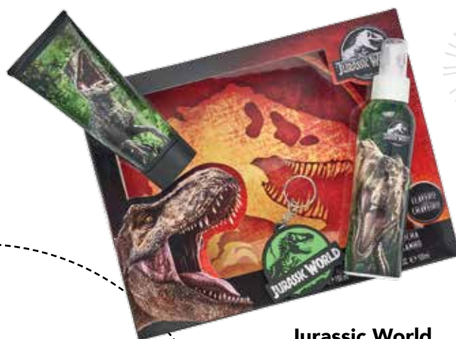
Jurassic World Eau de toilette, gel e porta-chaves.