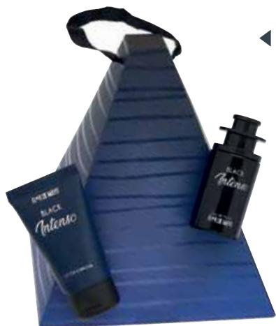
◀ Black Intenso Aromática especiada eau de parfum e loção corporal.