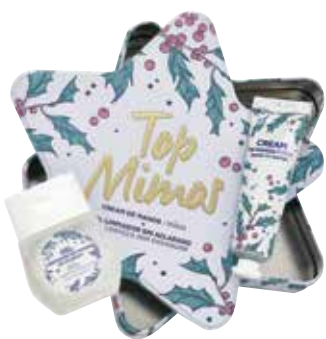
◀ Top Mimos Gel de limpeza de mãos sem enxaguar e creme hidratante.