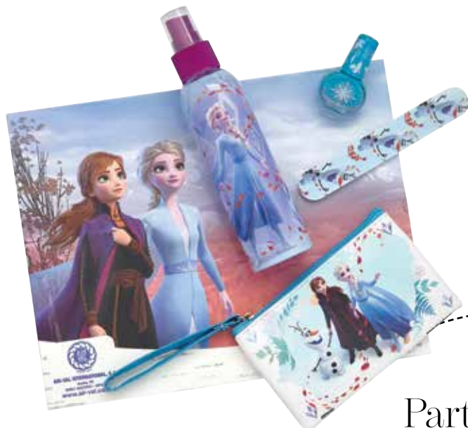
Frozen Eau de toilette, carteira, verniz e lima de unhas.