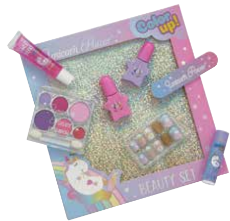
Unicorn Power Beauty Set * Paleta de sombras, lip balm, lip gloss, lima e dois vernizes de unhas, conjunto unhas postiças.

Acessórios cabelo Bandoletes, ganchos, laços... de veludo e cetim. Vários modelos à escolha.