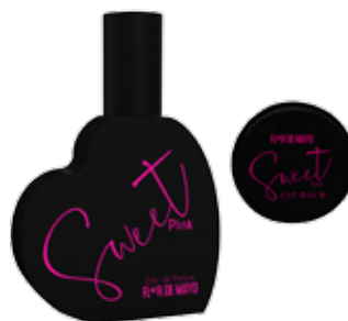
◀ Sweet Beauty Set Eau de parfum e lip balm.