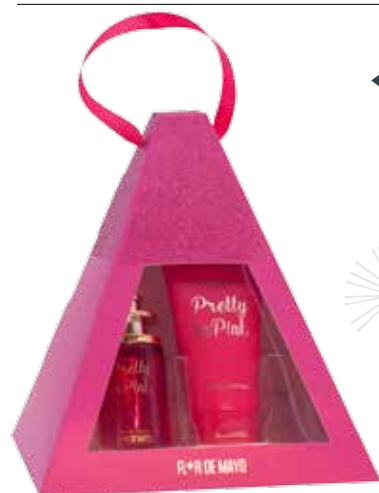
◀ Pretty in Pink Oriental frutal eau de parfum e loção corporal.