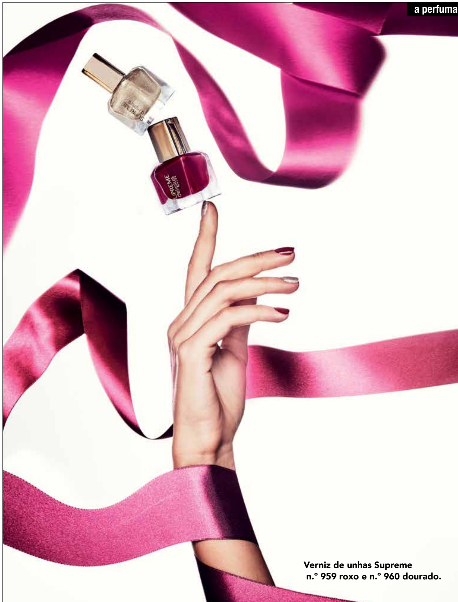
Verniz de unhas Supreme n.º 959 roxo e n.º 960 dourado.