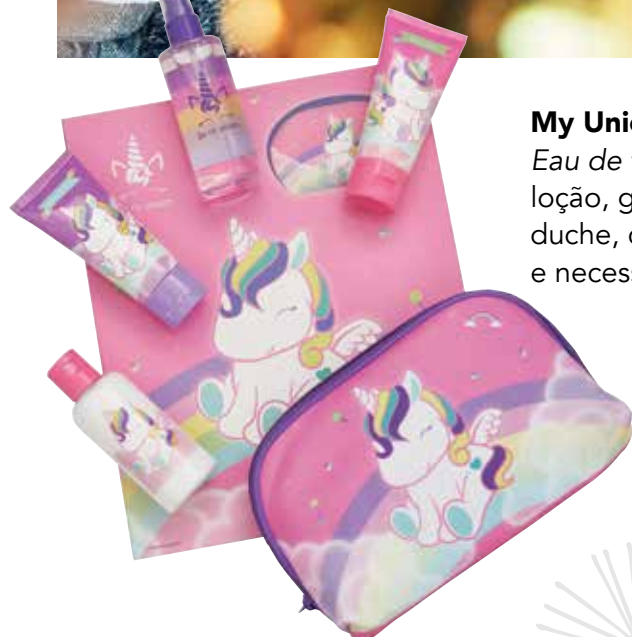
My Unicorn Eau de toilette, loção, gel de duche, champô e nécessaire.