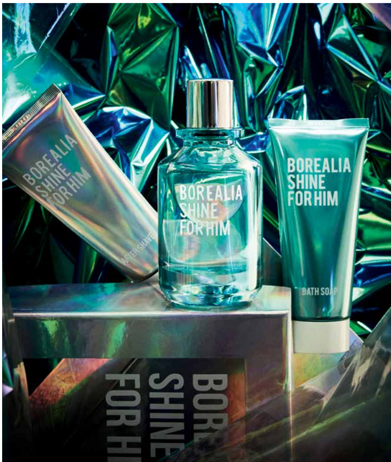
Borealia Shine for him. Eau de parfum, bath soap e after shave.

Existem momentos na vida que nunca se esquecem. Consegue imaginar-se a desfrutar do magnífico espetáculo das auroras boreais? Este fenómeno natural serviu como fonte de inspiração à Borealia Shine , reproduzindo o mágico reflexo da luz que se observa em todo o seu esplendor no hemisfério norte durante os meses mais frios do ano.