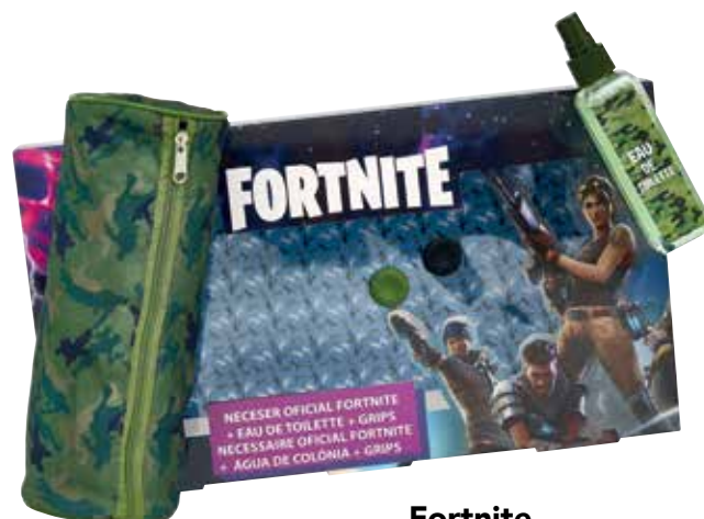
Fortnite Eau de toilette, nécessaire e grips.