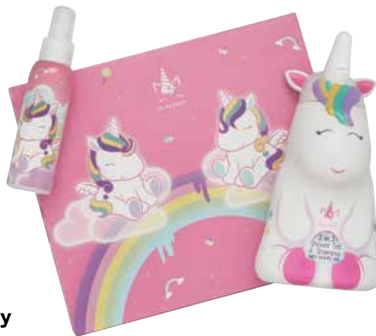
My Unicorn Eau de toilette e gel banho figura.