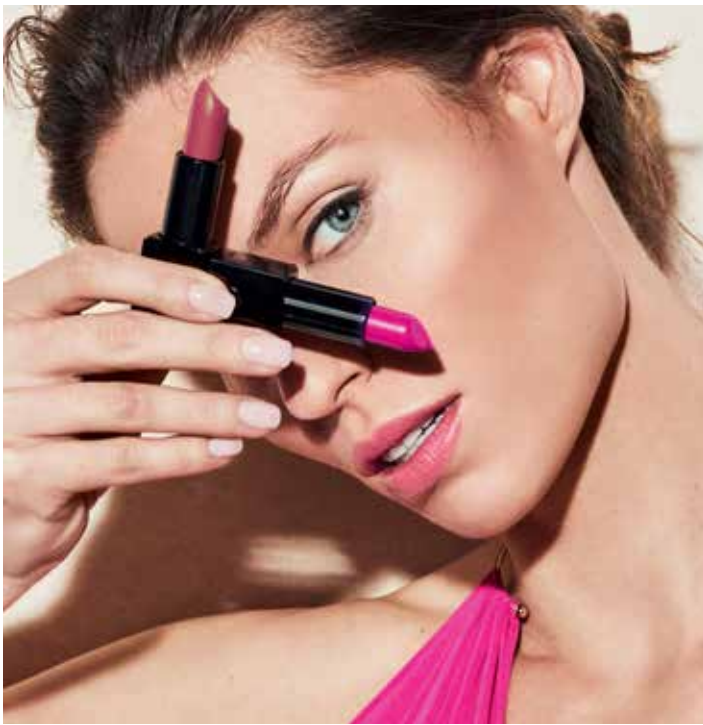
A modelo está a usar: Nos lábios, Creamy n.º 204. E nas mãos, Creamy n.º 204 e 205.