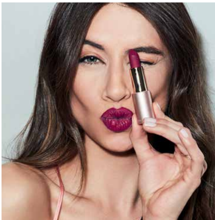
A modelo está a usar: Mate n.º 109.