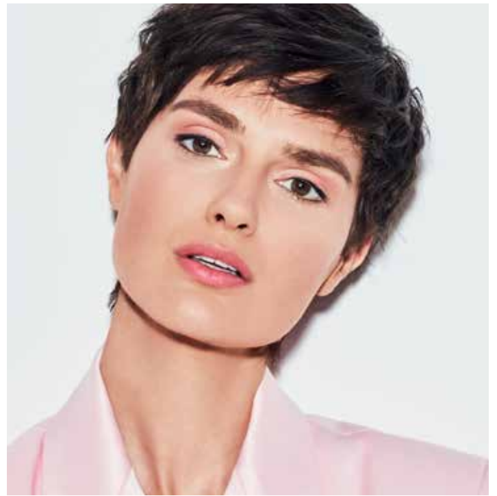
A modelo está a usar: Color Balm n.º 03.