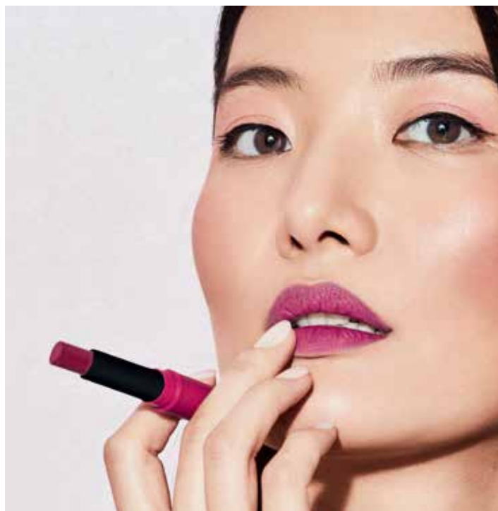
A modelo está a usar: Color Fix n.º 04.