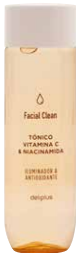
TÔNICO COM VITAMINA C E NIACINAMIDA