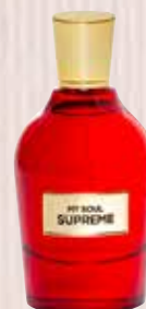
9 My Soul Supreme Nota olfativa oriental floral Eau de Parfum