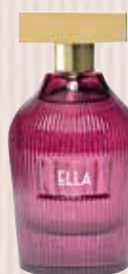
6 Ella Nota olfativa oriental floral Eau de Parfum