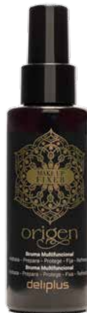
Bruma de rosto Origen

Aplique a bruma antes da sua rotina de skincare diária, para preparar a pele, ou depois da maquilhagem, para aumentar a sua duração.