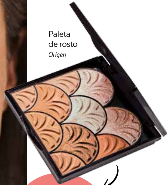
Paleta de rosto Origen

A mistura de iluminadores é o segredo para brilhar durante o dia, mas evitando excessos.