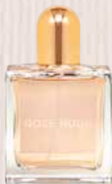
10 Rose Nude Nota olfativa floral atalcada Eau de Parfum