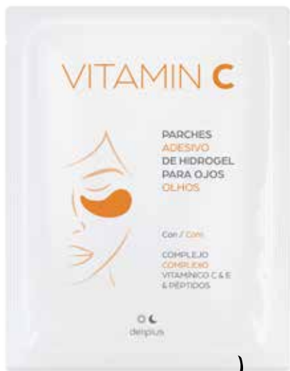
ADESIVOS HIDROGEL VITAMINA C PARA OS OLHOS