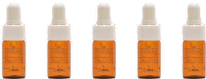
x5 BOOSTERS 20% VITAMINA C