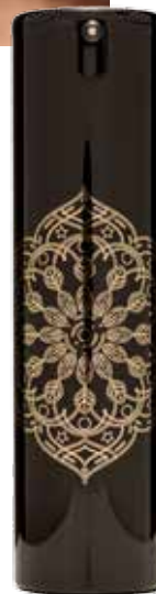
Iluminador de rosto Origen

Consiga uma maquiagem para cada ocasião com a coleção de maquiagem Origen . Aplique o iluminador de rosto e defina-o com a ajuda dos pós de sol escuros. Realce o olhar com a máscara de pestanas e dê cor aos lábios com o batom que mais gostar. A nossa recomendação é que use o rosa n.º 03 de dia, para dar vivacidade aos lábios, e o nude n.º 02 de noite, uma vez que vai realçar os lábios de forma natural. Para finalizar, sele a maquiagem com a bruma : a sua pele vai ficar hidratada e com um acabamento muito rejuvenescedor.