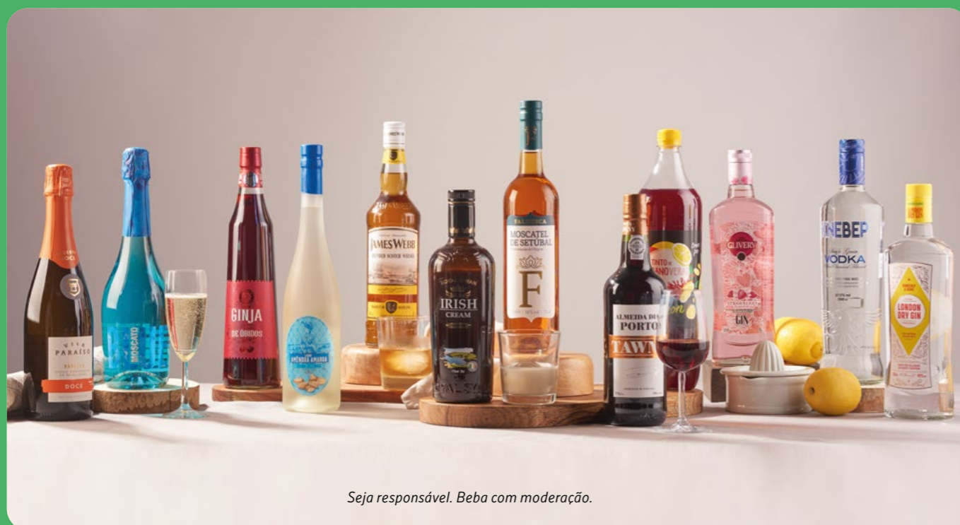
Seja responsável. Beba com moderação.