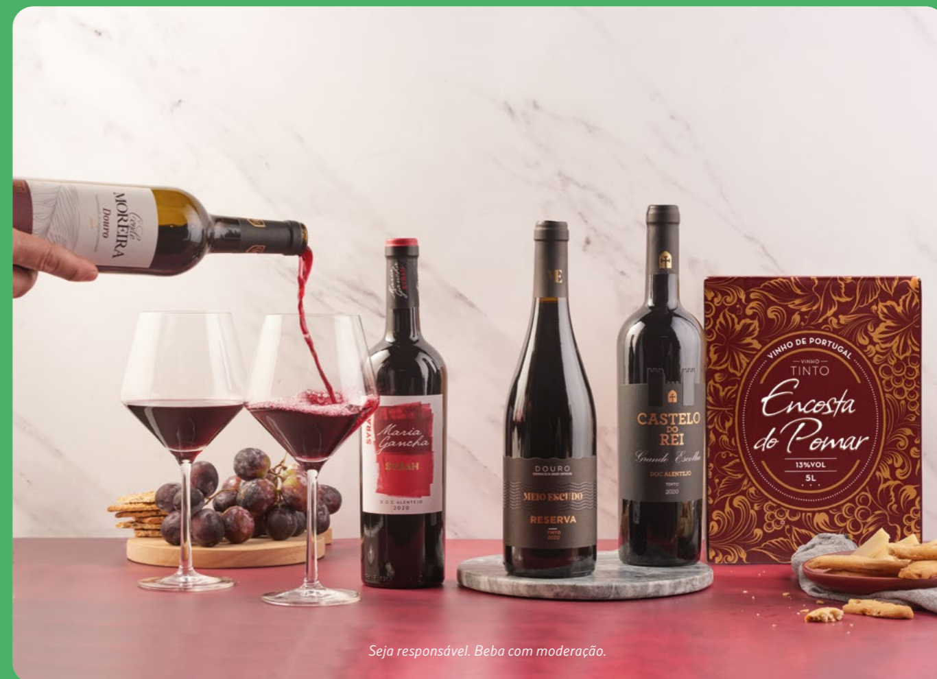
Seja responsável. Beba com moderação.