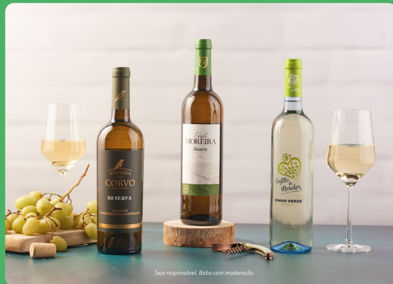
Seja responsável. Beba com moderação.